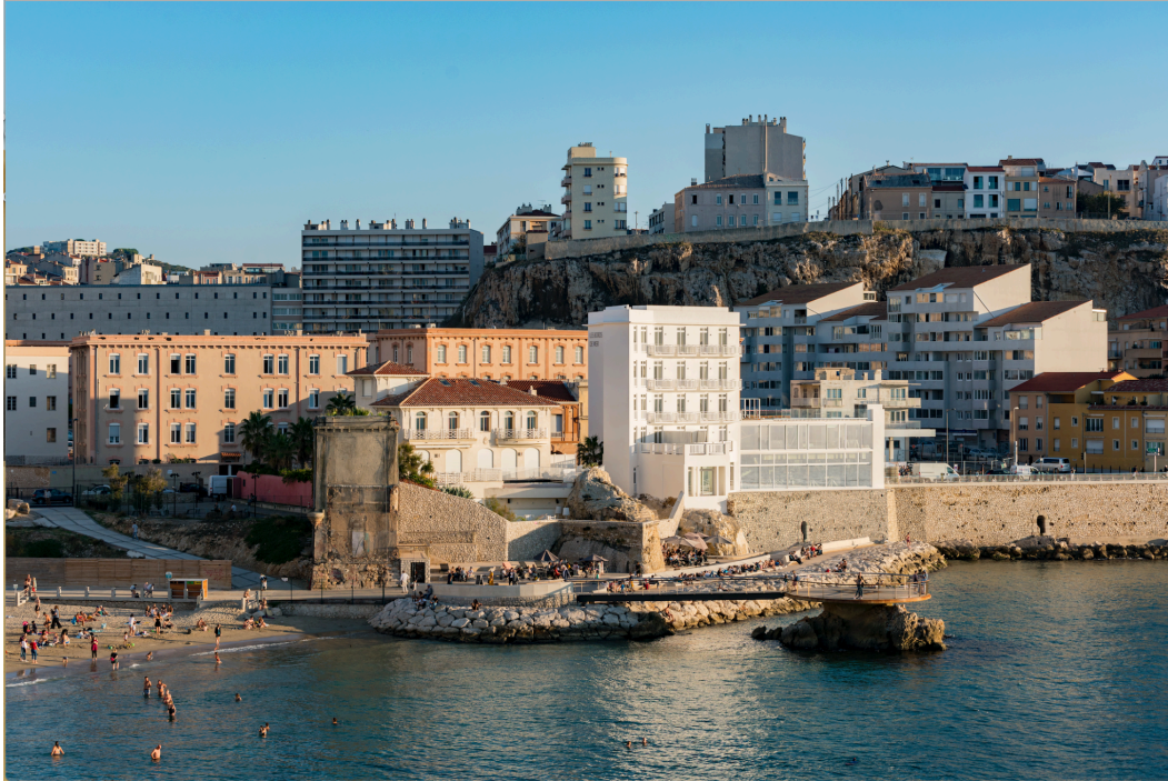
Les Bords de Mer, Marseille, France