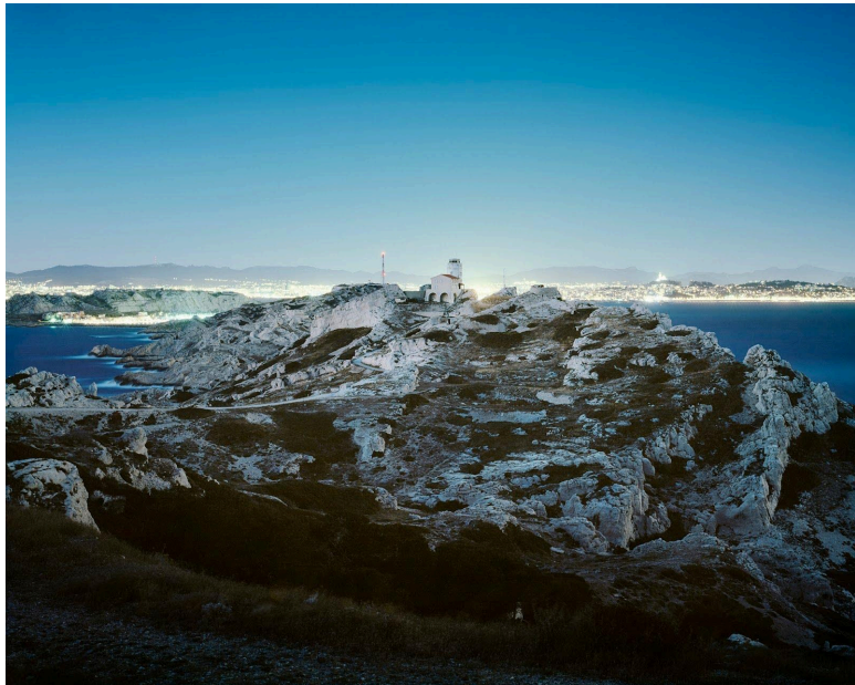
A gauche: Alice Guittard, Un été grec, la pluie , 2023, Marble inlay, 67 x 61 x 2,5 cm · 26,5 x 24 x 1 in, Courtesy the artist & Double V Gallery, © Joseph Alexiadis; à droite: Sébastien Normand, Périgée au Frioul , 2011 / 2015